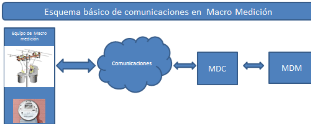
Figura 2. Modelo de bloques del sistema